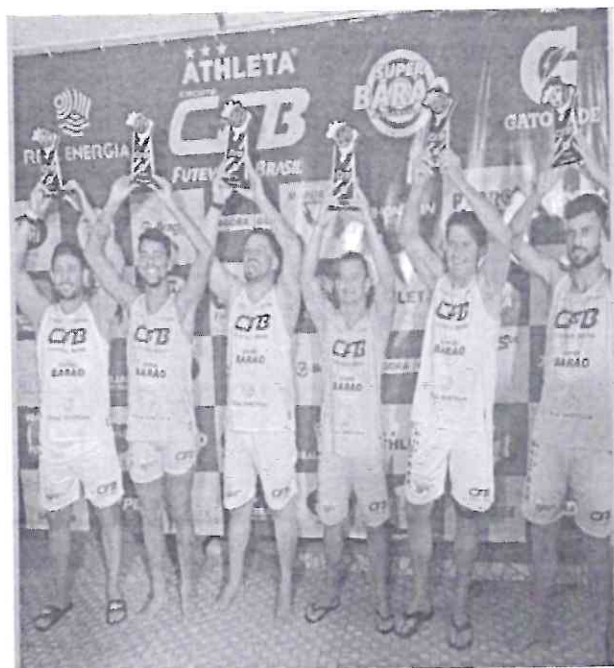
Athletas que participaram da competição